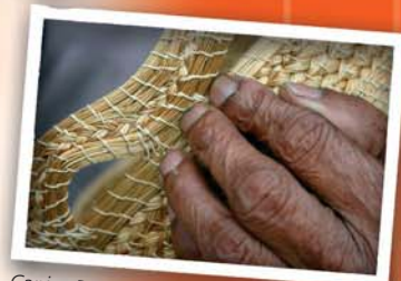
Capim Dourado, Jalapão, TO