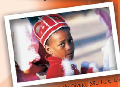
Festa do Divino, São Luis, MA