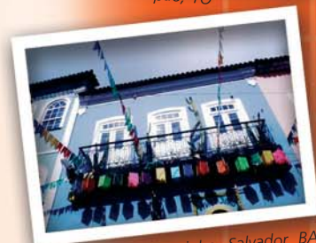
Pelourinho, Salvador, BA