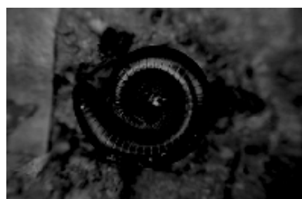
Falta de luminosidade

O fotômetro das máquinas fotográficas mede uma luz que passa pela objetiva em seu centro, na parte central da imagem ou em todo o quadro. Alguns equipamentos medem somente num único setor. Nem sempre, o fotômetro incorporado às câmeras fotográficas retorna uma relação ideal entre velocidade e diafragma; às vezes, isto ocorre quando o assunto principal está fora do setor de fotometragem.