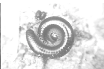
Excesso de luminosidade