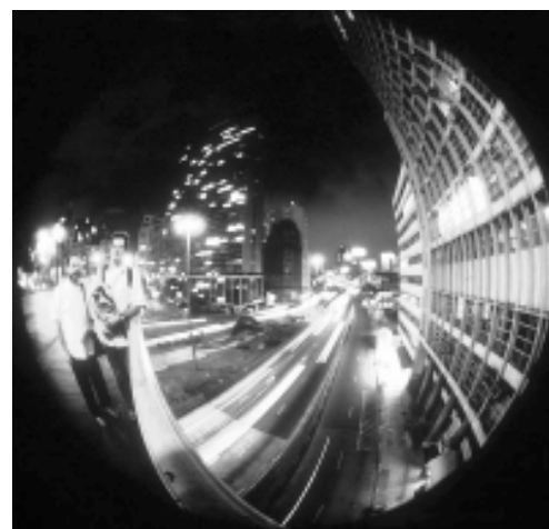
Olho de Peixe

As lentes macros permitem retratar assuntos pequenos e onde o tamanho destes não diferem muito do tamanho da imagem na película. O outro tipo, as micros, possibilitam a fotografia de assuntos muito pequenos e a imagem destes serão sempre maiores.