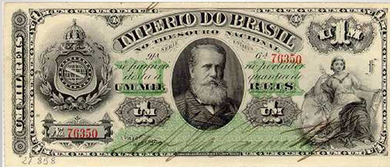
Cédula de mil réis, emitida durante o Segundo Império. Imagem em destaque de Dom Pedro II.