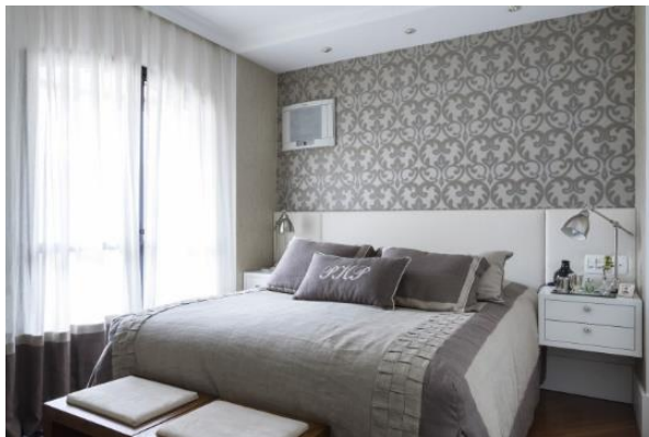
Figura 3: Projeto de quarto de Patricia Pasquini