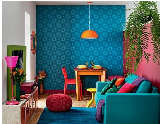
Figura 5: Exemplo de Ponto Focal bem colorido. Perceba que seu olho é levado diretamente para a parede da frente e da direita. Na esquerda, mesmo utilizando peças coloridas, não tira sua atenção do ponto focal. Projeto: Adriana Yazbek

O resto acompanha, mas lembre-se de não tentar disputar com o ponto focal, use o que chama atenção ali e no resto mantenha escolhas mais neutras, pode usar um tapete legal, uma almofada em um sofá que não está nesse ponto focal com as cores escolhidas, mas evite usar outra parede muito colorida ou um sofá muito chamativo, mantenha as cores e estampas para os acessórios menores.