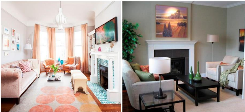
Figura 4: Dois exemplos de disposição de móveis em volta da lareira, no primeiro de frente e o segundo de lado!

Esse “canto” deve ser trabalhado de forma a valorizar o ambiente. Não significa que devemos deixar o resto de lado, mas podemos usar o que chama atenção ali e o resto manter mais neutro, por exemplo. Esse também será o ponto onde você deve começar a trabalhar e o resto dos móveis, deverão integrar esse espaço. Por exemplo, você tem uma lareira que será seu ponto focal, de nada adiantará colocar um sofá na frente virado de costas para ela, certo?