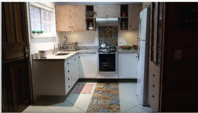
Figura 1: Cozinha Projeto Lily Fontana

Agora pesquise! Veja revistas e sites e guarde todas as imagens que te agradem. Não importa o tamanho do ambiente que gostou, verifique com calma o que te agrada. São as cores? Tecidos? E o que não gostou? Saber o que não gostou é maravilhoso, pois assim não repete no seu ambiente.