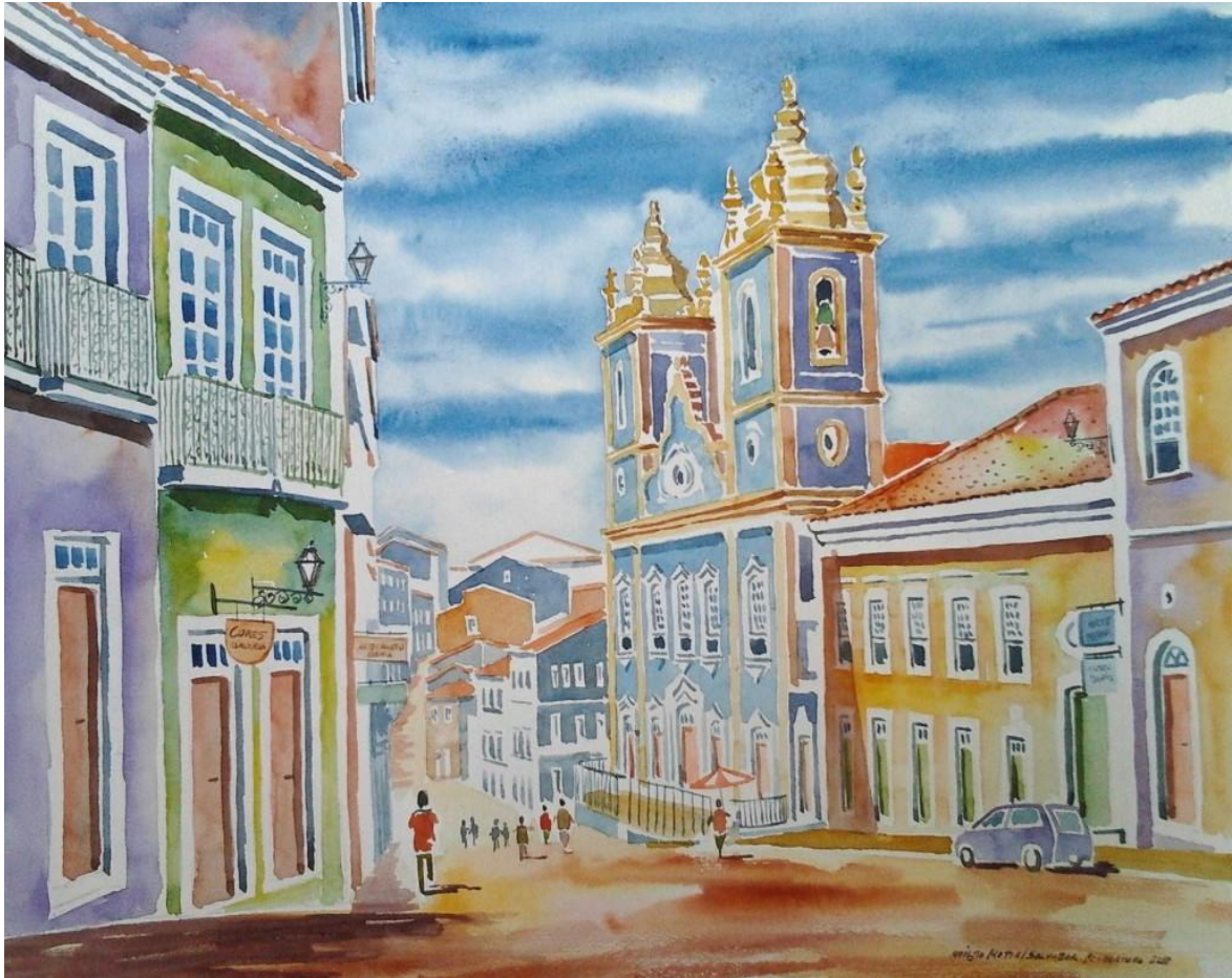
Aquarela do Pelourinho passo a passo

Essa semana estive nessa maravilhosa praça na cidade de Salvador e resolvi pintá-la e nessa aula vou apresentar os procedimentos efetuados, materiais, técnicas e métodos passo a passo. Este site já possui mais de 14 aulas nas quais explico em detalhes todas as técnicas usadas na execução das pinturas que aqui apresento e espero estar contribuindo para o desenvolvimento artístico dos visitantes despertando o talento oculto que existe em muitas pessoas. Tenho recebido centenas de emails com agradecimentos e apoio contribuindo assim para que eu continue criando essas aulas e mantendo esse site no ar.