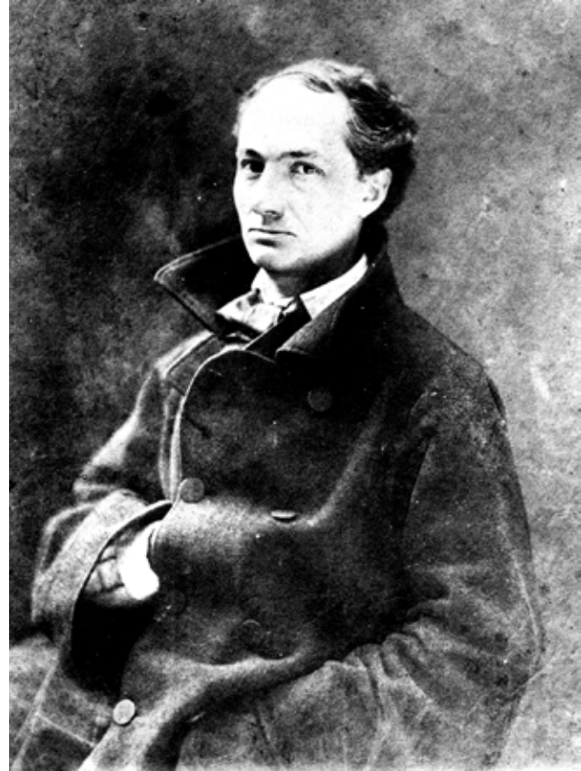
Baudelaire fotografado por Nadar, 1855.

“Meu caro Morel, quando o senhor me honrou pedindo-me a análise do Salão, disse-me: “Seja breve, não faça um catálogo, mas um arrazoado geral, algo como o relato de um rápido passeio filosófico através das pinturas”. (...) O embaraço teria sido grande se eu me tivesse perdido numa floresta de originalidades, se o temperamento moderno francês, repentinamente modificado, purificado e rejuvenecido, houvesse dado flores tão vigorosas e de um perfume tão variado a ponto de criar uma comoção irrepreensível, se houvesse motivado elogios abundantes, uma admiração eloqüente, e a necessidade de categorias novas dentro do idioma crítico. Mas de modo algum, felizmente (para mim). Nenhuma explosão, nada de gênios desconhecidos. Os pensamentos sugeridos pela aparência desse Salão são de uma ordem tão simples, tão antiga, tão clássica, que poucas páginas serão sem dúvida suficientes para desenvolvê-los.” (BAUDELAIRE, “O Artista Moderno”, 1959)