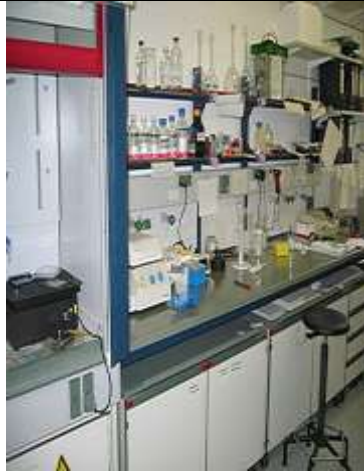
Laboratório de bioquímica.