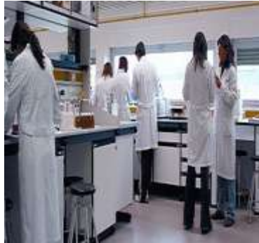
Cientistas trabalhando em um laboratório.